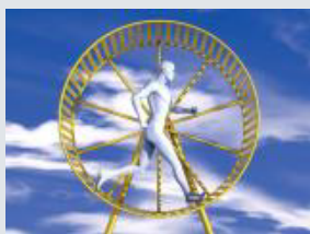
PAIN ACADEMY AUGSBURG®